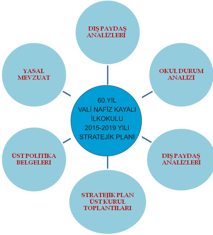
Şekil 1: Stratejik Plan Hazırlık Çalışmaları